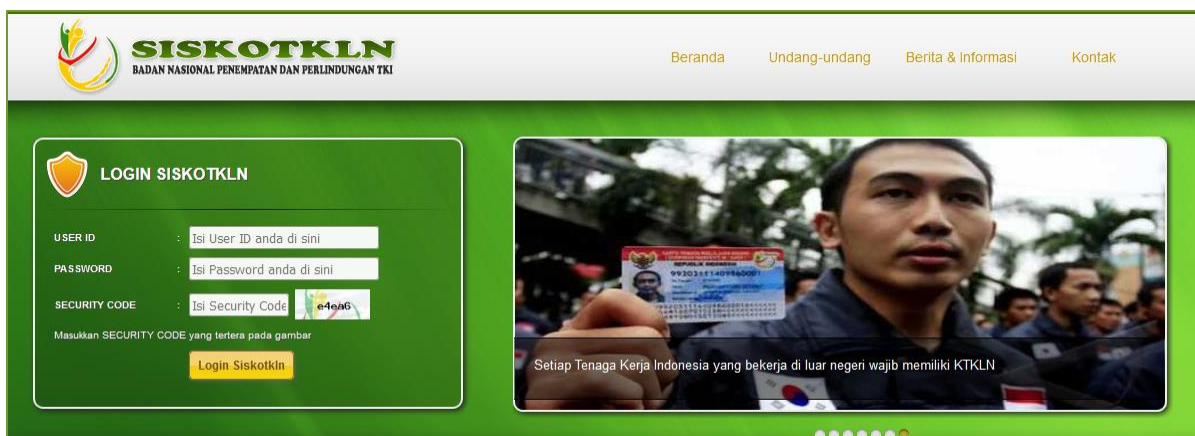
Gambar 1. Login SISKOTKLN

Kepala bagian BP3TKI/P4TKI/LP3TKI dapat mengajukan user baru dan menonaktifkan user yang sudah tidak aktif, dengan mengakses alamat http://siskotkln.bnp2tki.go.id/ dan login menggunakan User ID dan Password yang telah diberikan oleh BNP2TKI, seperti pada gambar berikut.